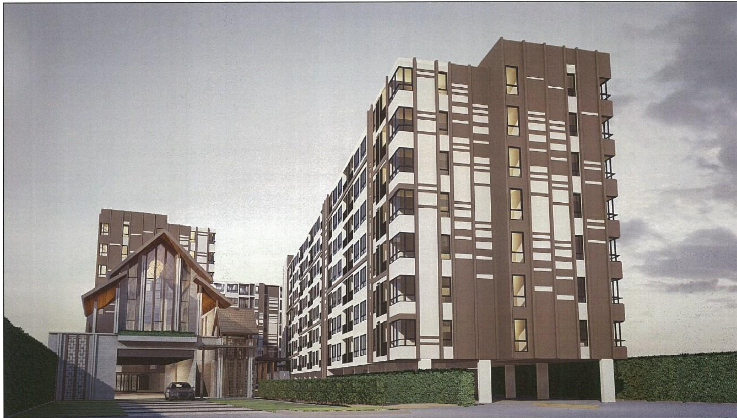
รูปที่ 1-3 รูปแบบทางสถาปัตยกรรม